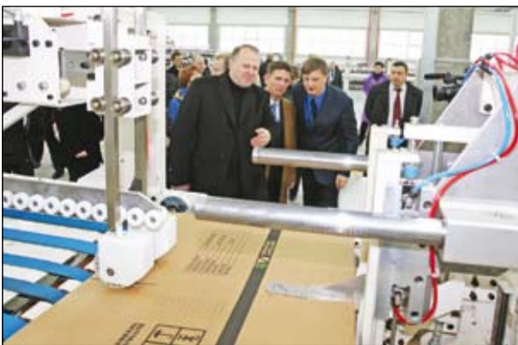
Торжественная церемония запуска главной технологической линии