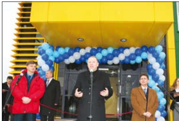
«Это важное событие областного значения», — подчеркнул губернатор Калининградской области Н.Н. Цуканов и пожелал успехов трудовому коллективу