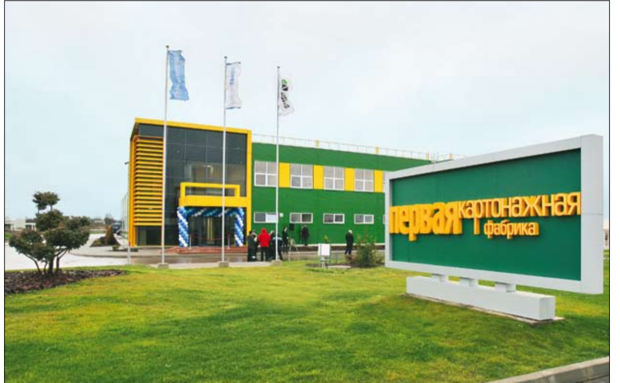
Потребности калининградских производителей в качественной, экологически чистой упаковке и бугорчатой таре будут полностью обеспечены возможностями нового комплекса. Проектная мощность фабрики — 80 млн кв. м гофротары в год