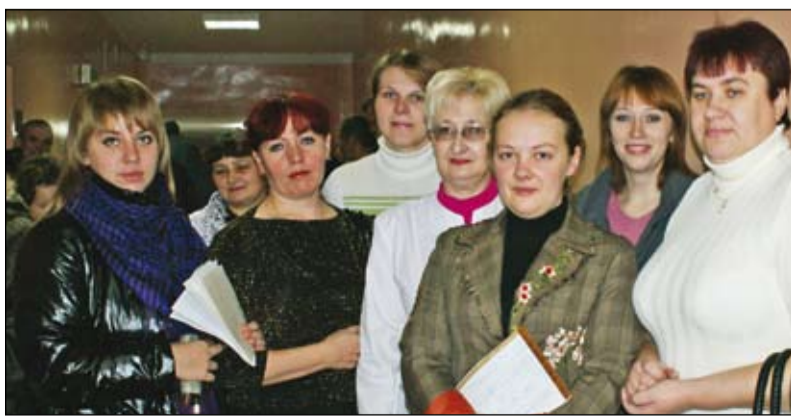
Перед сдачей донорской крови

Переливание крови делают ежегодно полтора миллионам россиян. Кровь требуется пострадавшим от ожогов и травм, при проведении