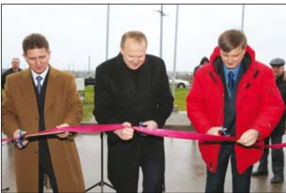
Введено в эксплуатацию четвертое из пяти запланированных в рамках проекта «Технополис Гусев» предприятий