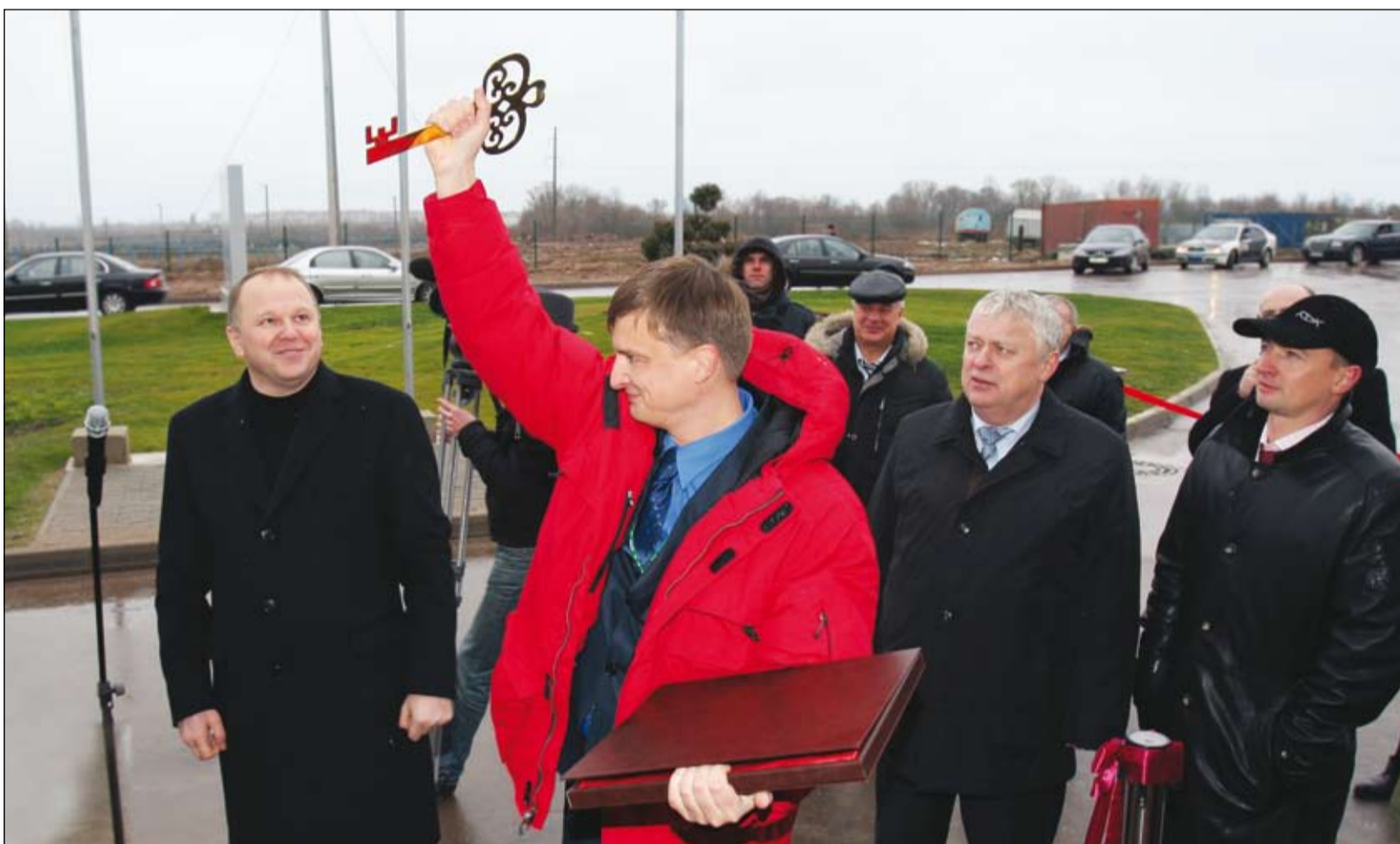
Символический ключ от крупнейшего в регионе предприятия по производству гофрокартона и гофроупаковки