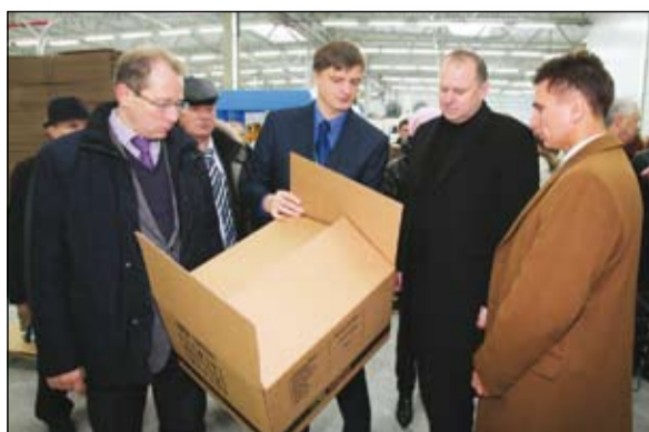
Завод будет выпускать три вида продукции: гофрокартон, гофроупаковку и бугорчатую тару, которую изготавливают из отходов производства первых двух